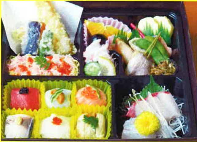
てまり御膳 ¥2,300+税 ¥2,484