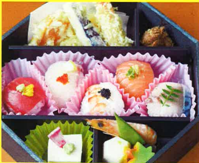
てまり八角弁当 ¥1,700+税 ¥1,836