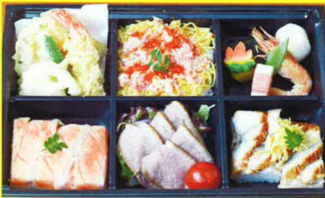
美織御膳 ¥2,000+税 ¥2,160