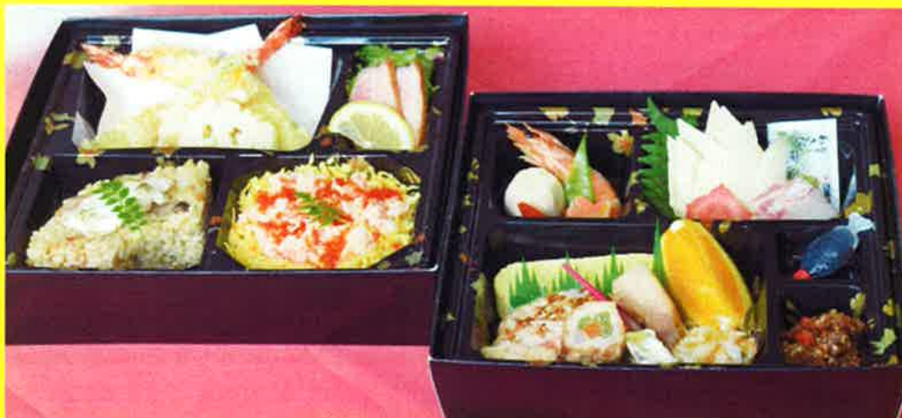
二段弁当 金剛 ¥2,315+税 ¥2,500