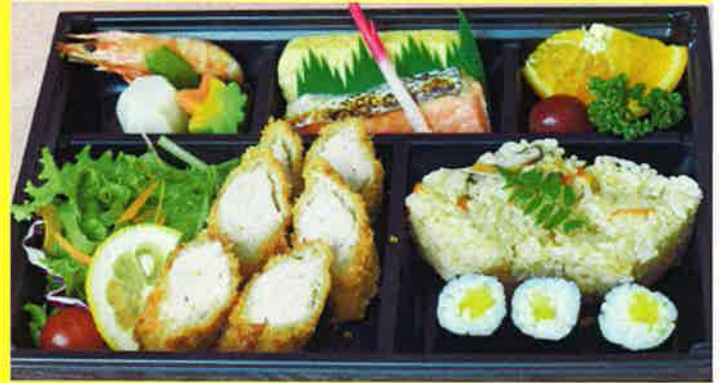
ロールカツ弁当 ¥1,800+税 ¥1,944