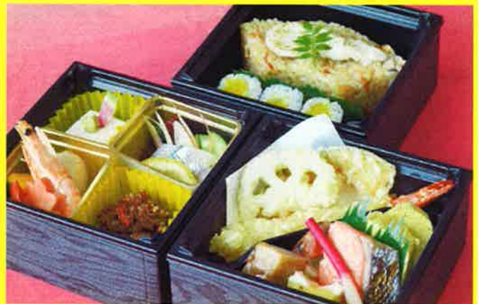
三段弁当 湖水 ¥1,852+税 ¥2,000