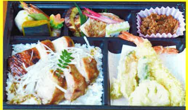
若松御膳 ¥1,797+税 ¥1,940