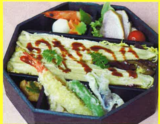
八角穴子チラシ ¥2,200+税 ¥2,376