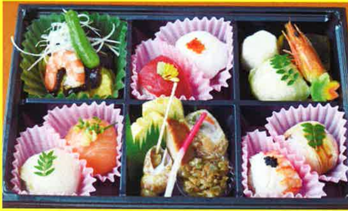
玉手箱 ¥1,800+税 ¥1,944