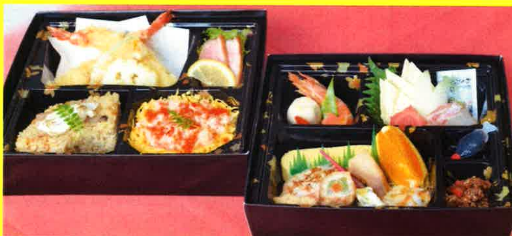
二段弁当 金剛 ¥2,315+税 ¥2,500