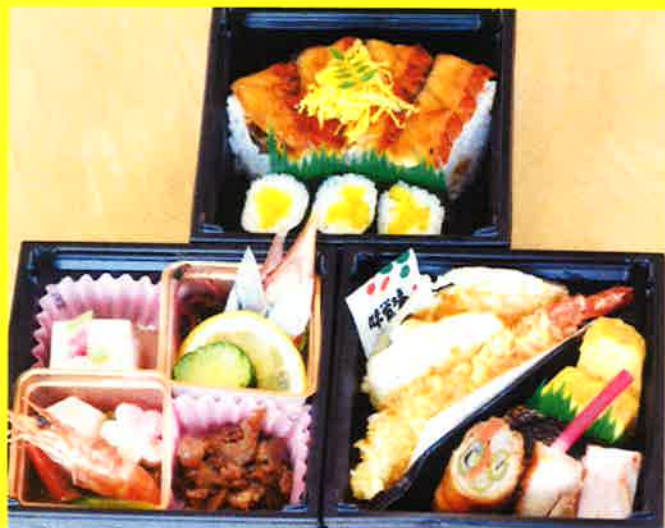
三段弁当 湖水 ¥1,852+税 ¥2,000