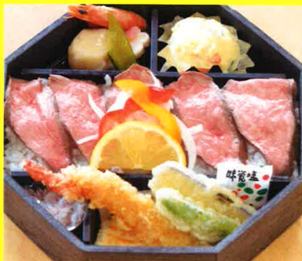
八角ローストビーフ弁当 ¥2,200+税 ¥2,376