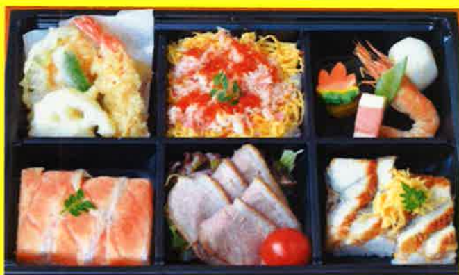
美織御膳 ¥2,000+税 ¥2,160