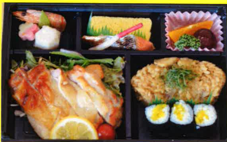
ローストチキン弁当 ¥1,800+税 ¥1,944