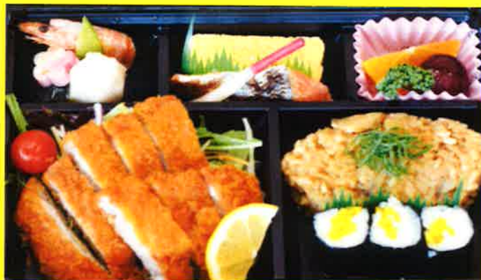
宮崎豚とんかつ弁当 ¥1,800+税 ¥1,944