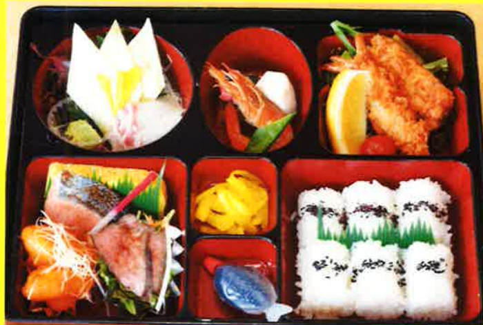
お手軽弁当 ¥1500+税 ¥1,620