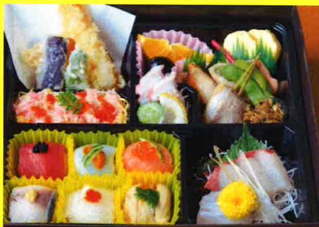
てまり御膳 ¥2,300+税 ¥2,484