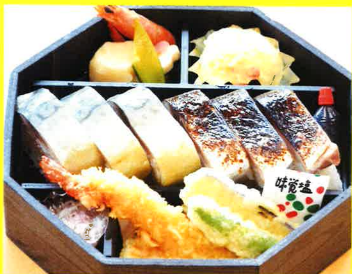
八角鯖押寿司弁当 ¥2,200+税 ¥2,376