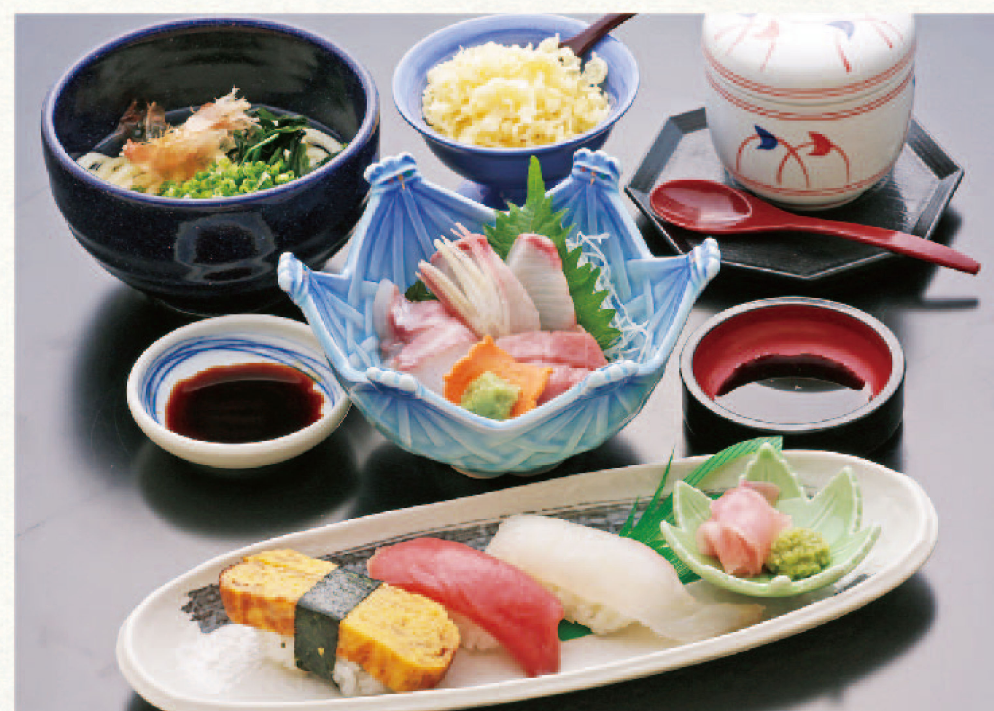
刺身3種類とにぎり・麺・茶碗蒸セット 2,380円+税(税込2,618円)