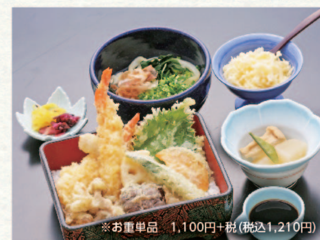
天ぷら重と麺セット 1,490円+税 (税込1,639円)