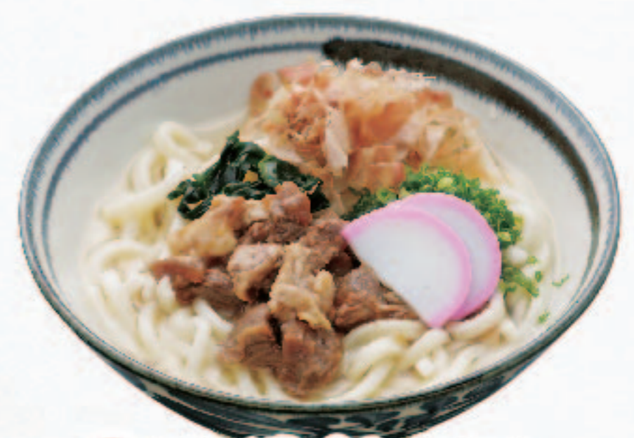
温 近江牛すじうどん 1,380円+税 (税込1,518円)