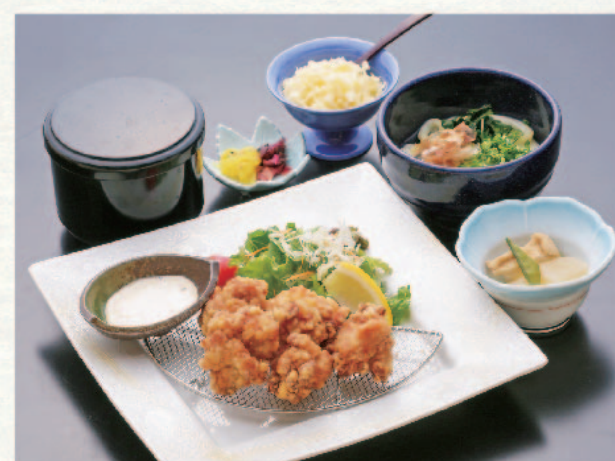
唐揚げ定食 1,380円+税 (税込1,518円)