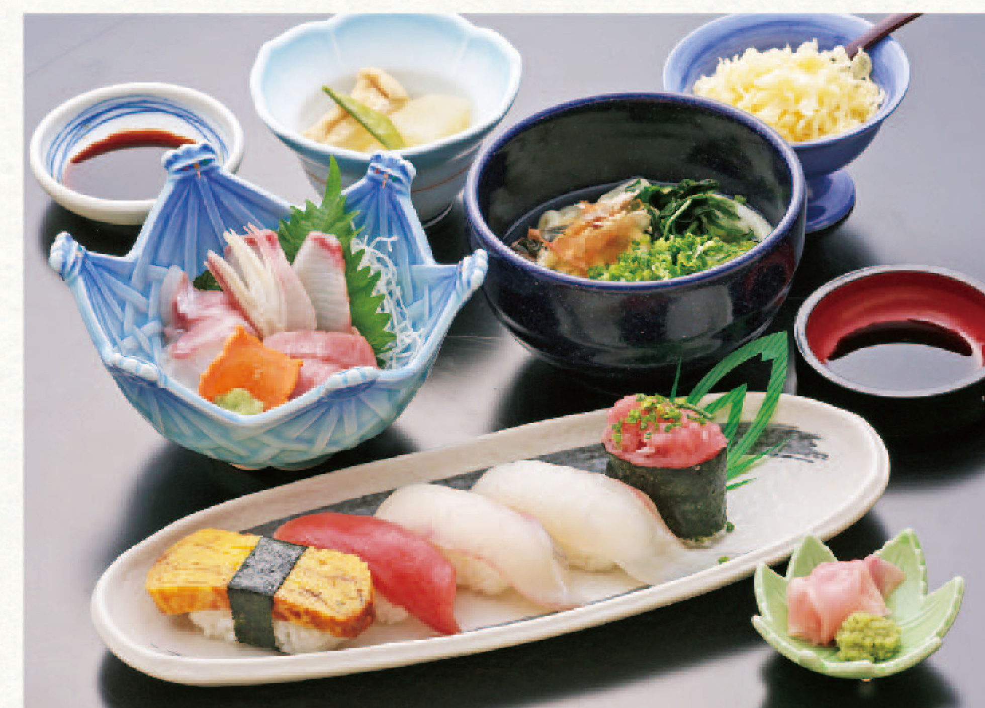
にぎり寿司5貫と刺身・麺セット 2,830円+税(税込3,113円)