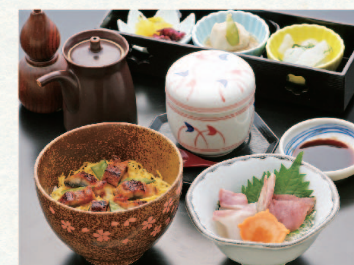
うなぎきしり丼ミニ (白飯) と刺身・茶碗蒸又はあら汁セット 2,280円+税 (税込2,508円)