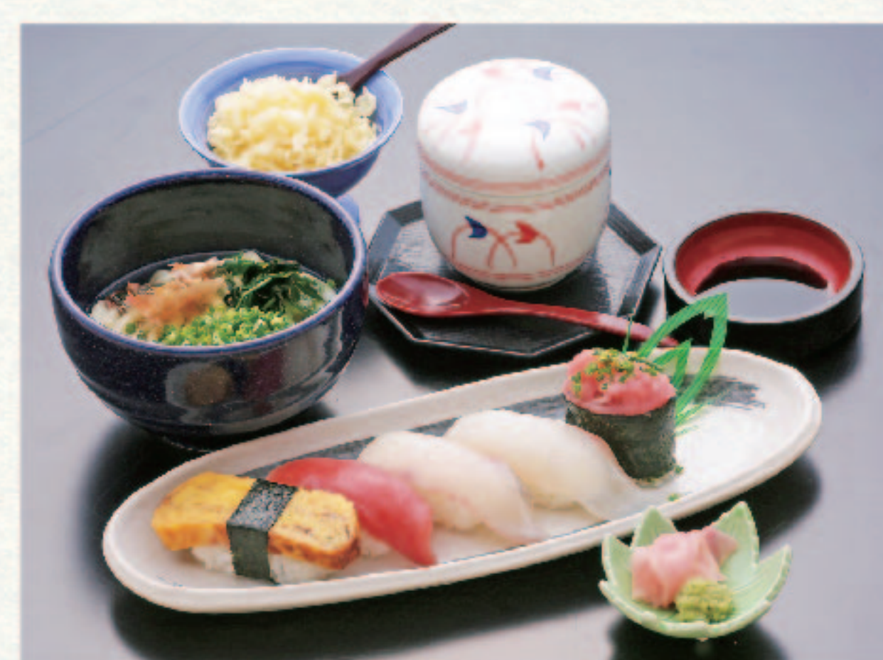
にぎり寿司5貫と茶碗蒸・麺セット 1,780円+税 (税込1,958円)