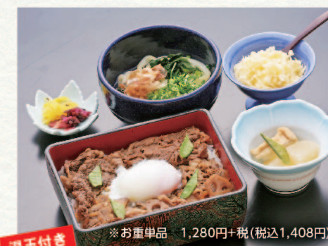
近江牛入りすきやき重と麺セット 1,680円+税 (税込1,848円)