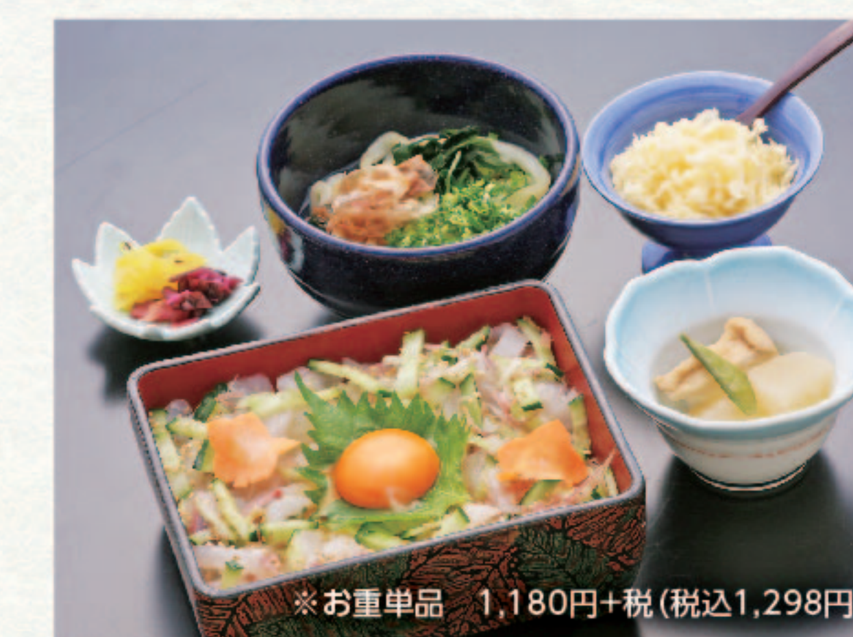
海鮮ユッケ重と麺セット 1,580円+税 (税込1,738円)