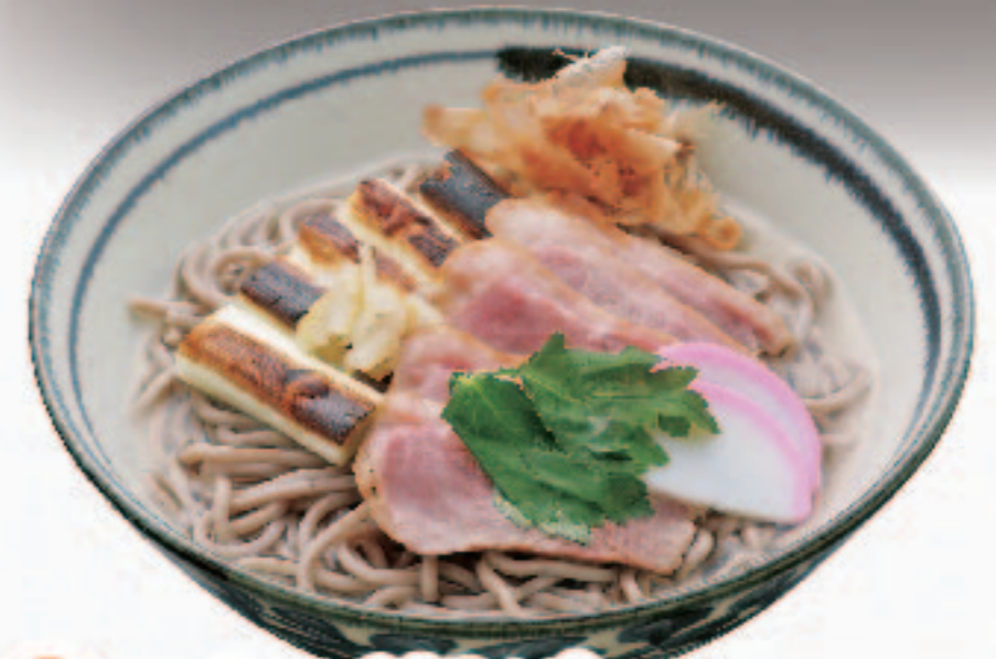
温 かもねぎそば (伊吹そば使用) 1,380円+税 (税込1,518円)