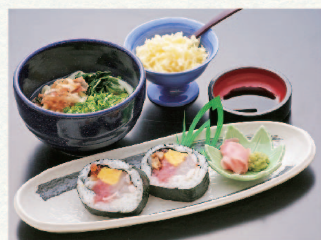
松研巻2切と麺セット 980円+税 (税込1,078円)