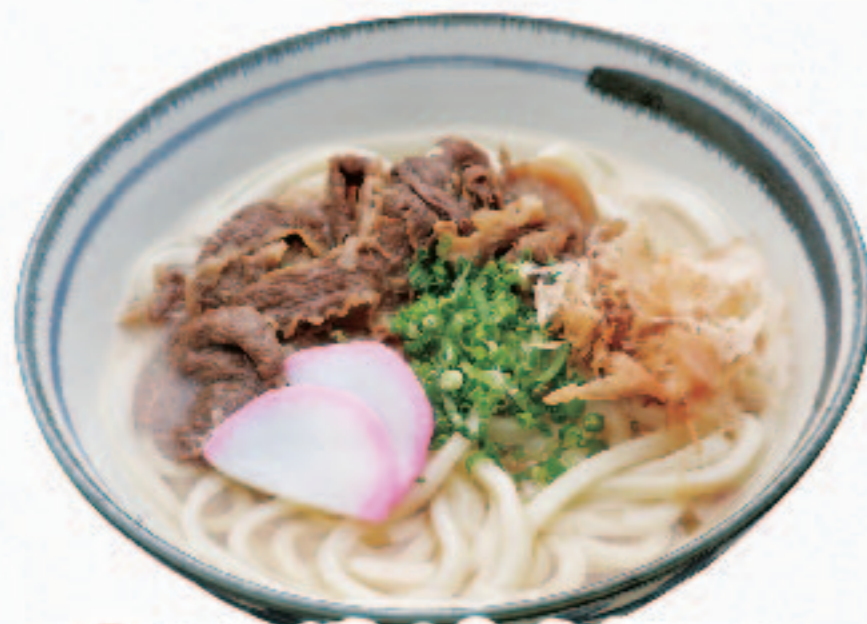
温 近江牛入り肉うどん 1,380円+税 (税込1,518円)