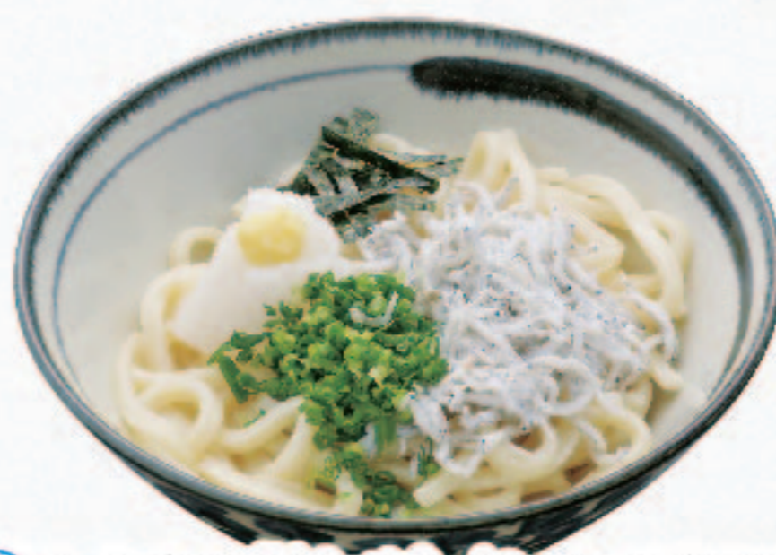
冷 しらす大根おろしぶっかけうどん 1,000円+税 (税込1,100円)