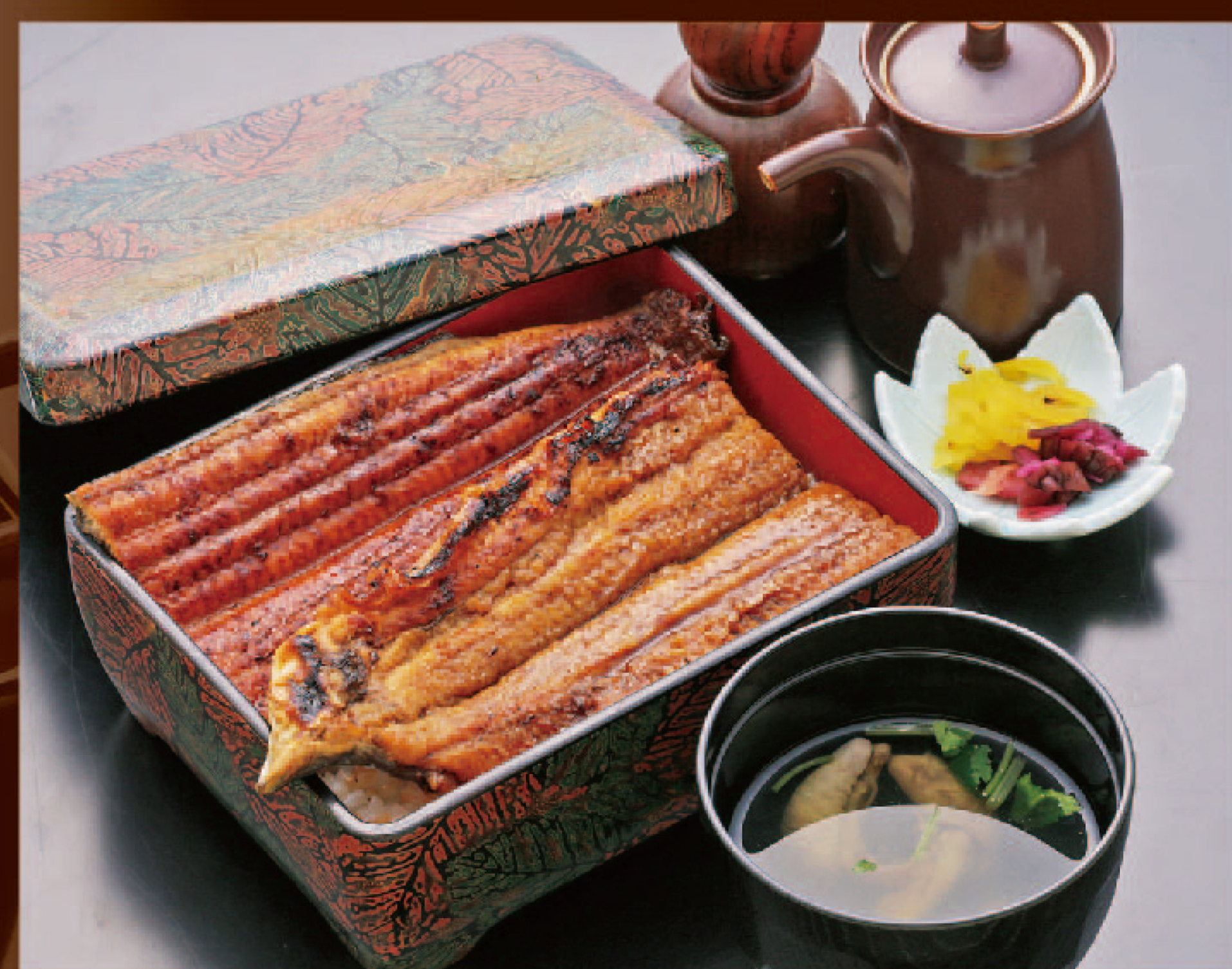
国産うな重一尾セット 6,000円+税(税込6,600円)