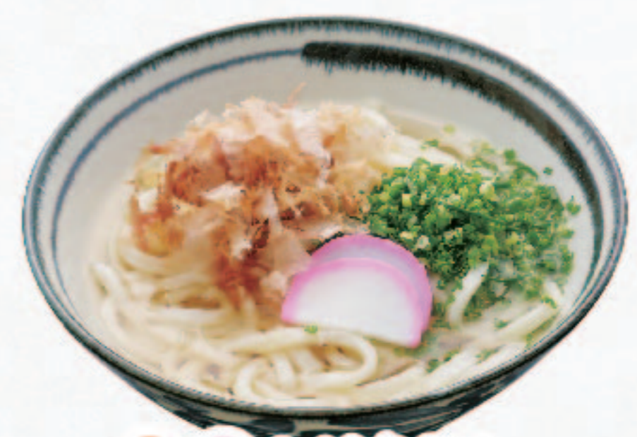
温冷 かけうどん 780円+税 (税込858円)