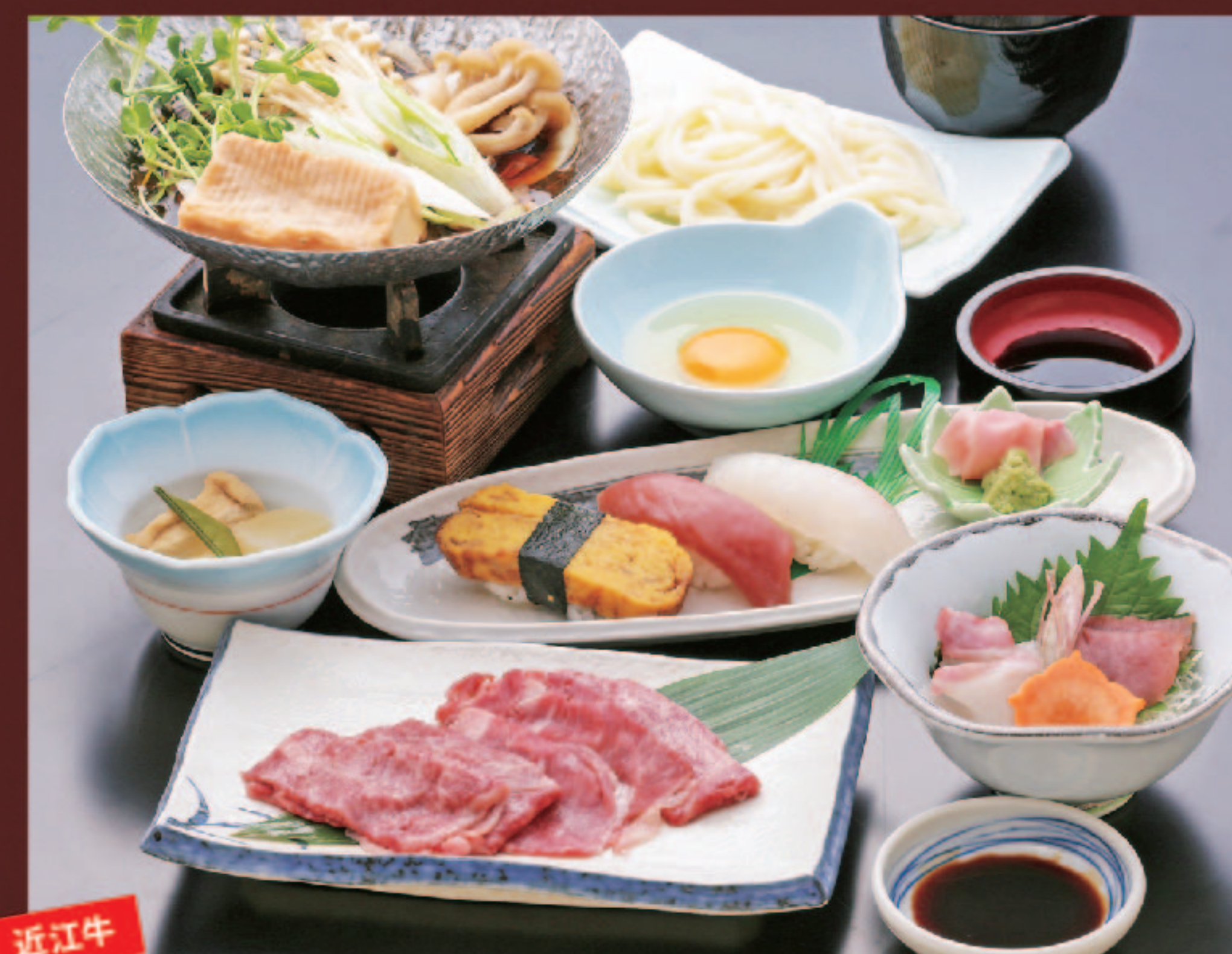
すき焼き100g にぎり3貫・茶碗蒸セット 3,430円+税 (税込3,773円)