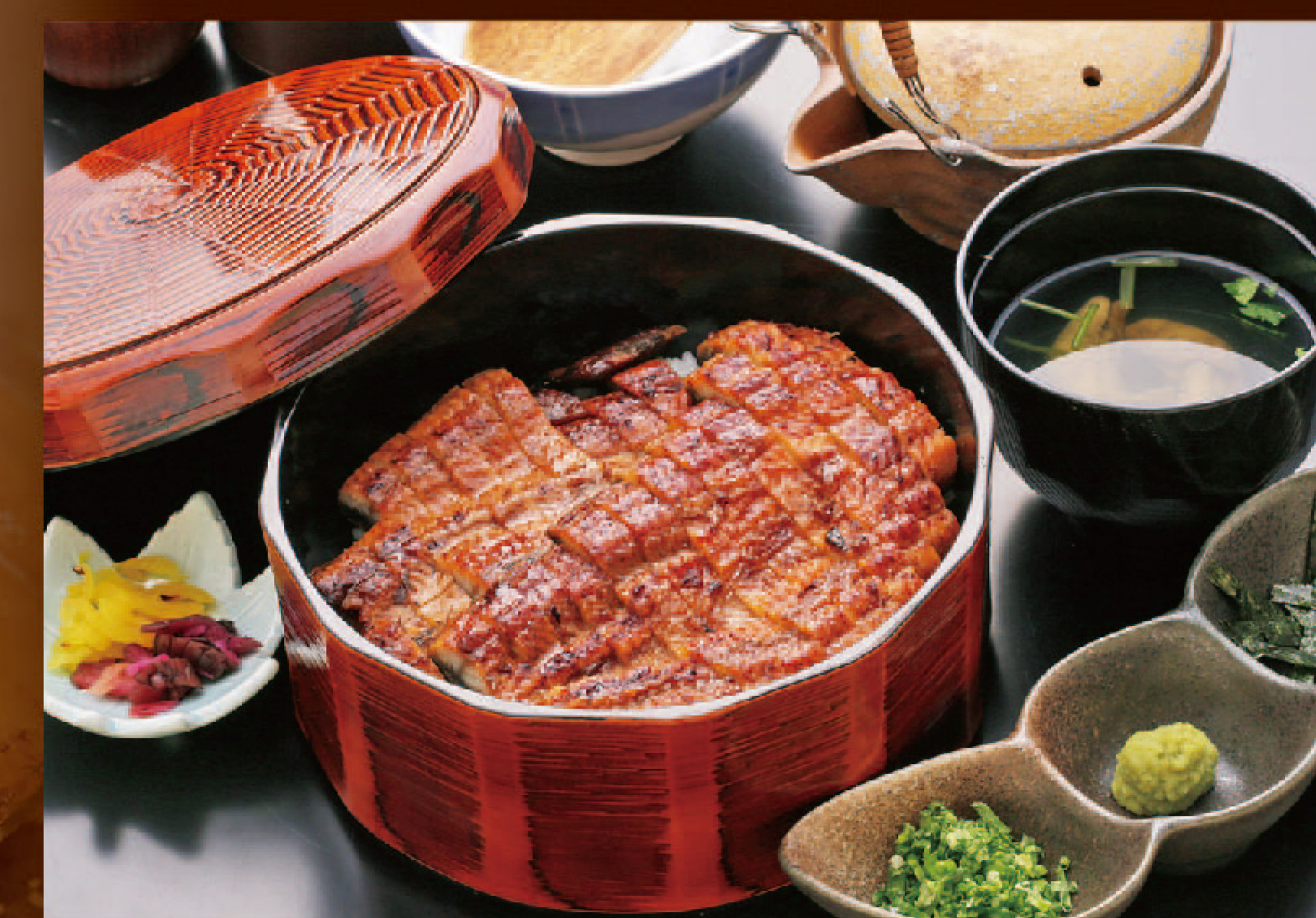
国産ひつまぶし一尾セット 6,880円+税(税込7,568円)