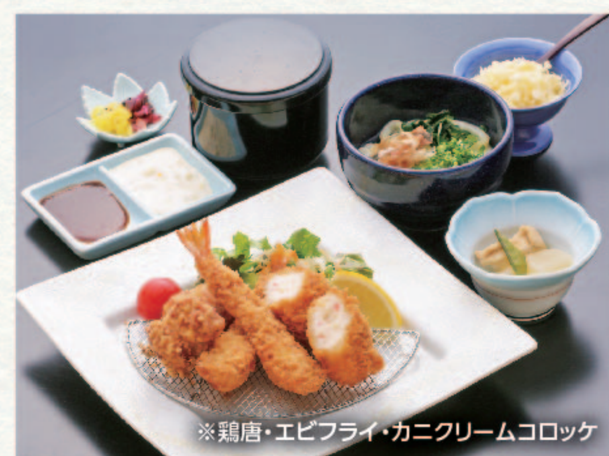
ミックスフライ定食 1,380円+税 (税込1,518円)