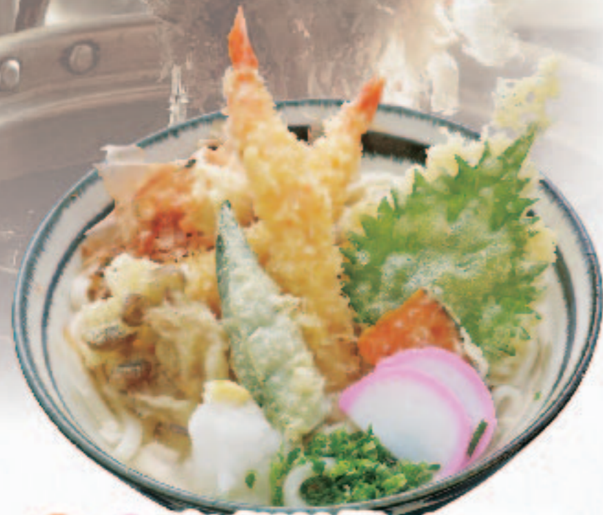
温冷 海老野菜天うどん 1,380円+税 (税込1,518円)