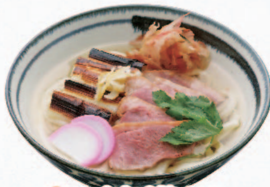
温 かもねぎうどん 1,380円+税 (税込1,518円)