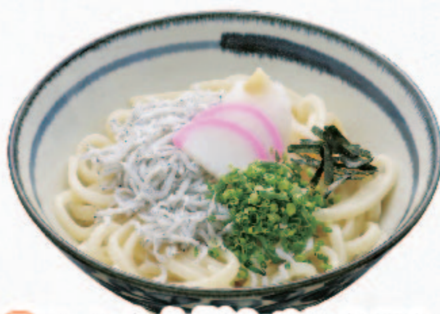
温 しらす大根おろしうどん 1,000円+税 (税込1,100円)