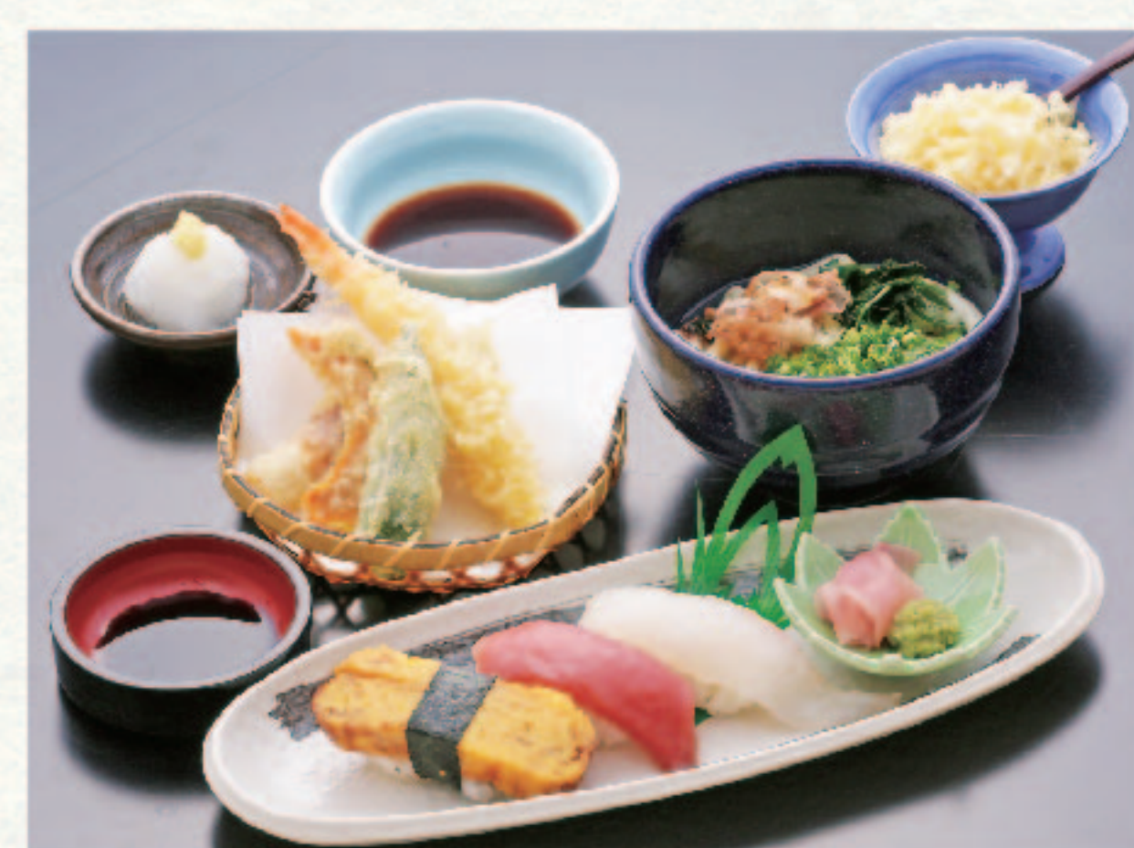
にぎり寿司3貫と天ぷら・麺セット 1,380円+税 (税込1,518円)