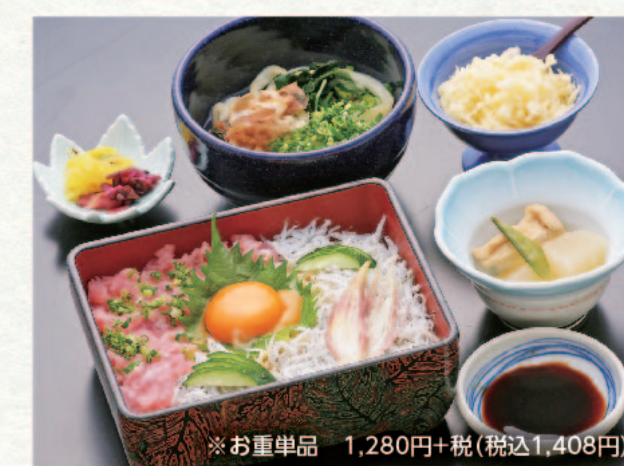
ネギトロしらす重と麺セット 1,660円+税 (税込1,826円)