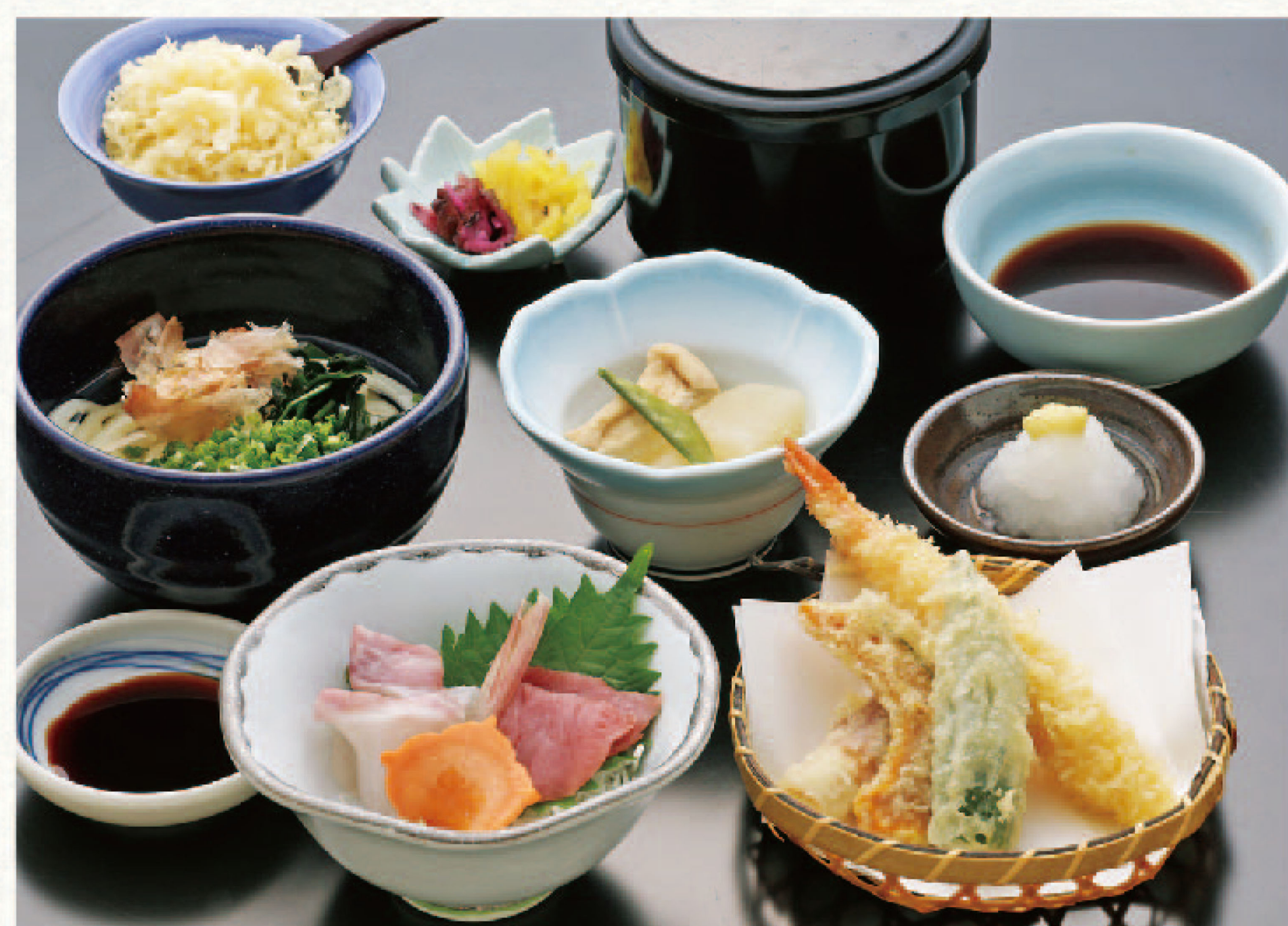
刺身2種と天ぷら・麺セット(白飯付) 1,890円+税(税込2,079円)