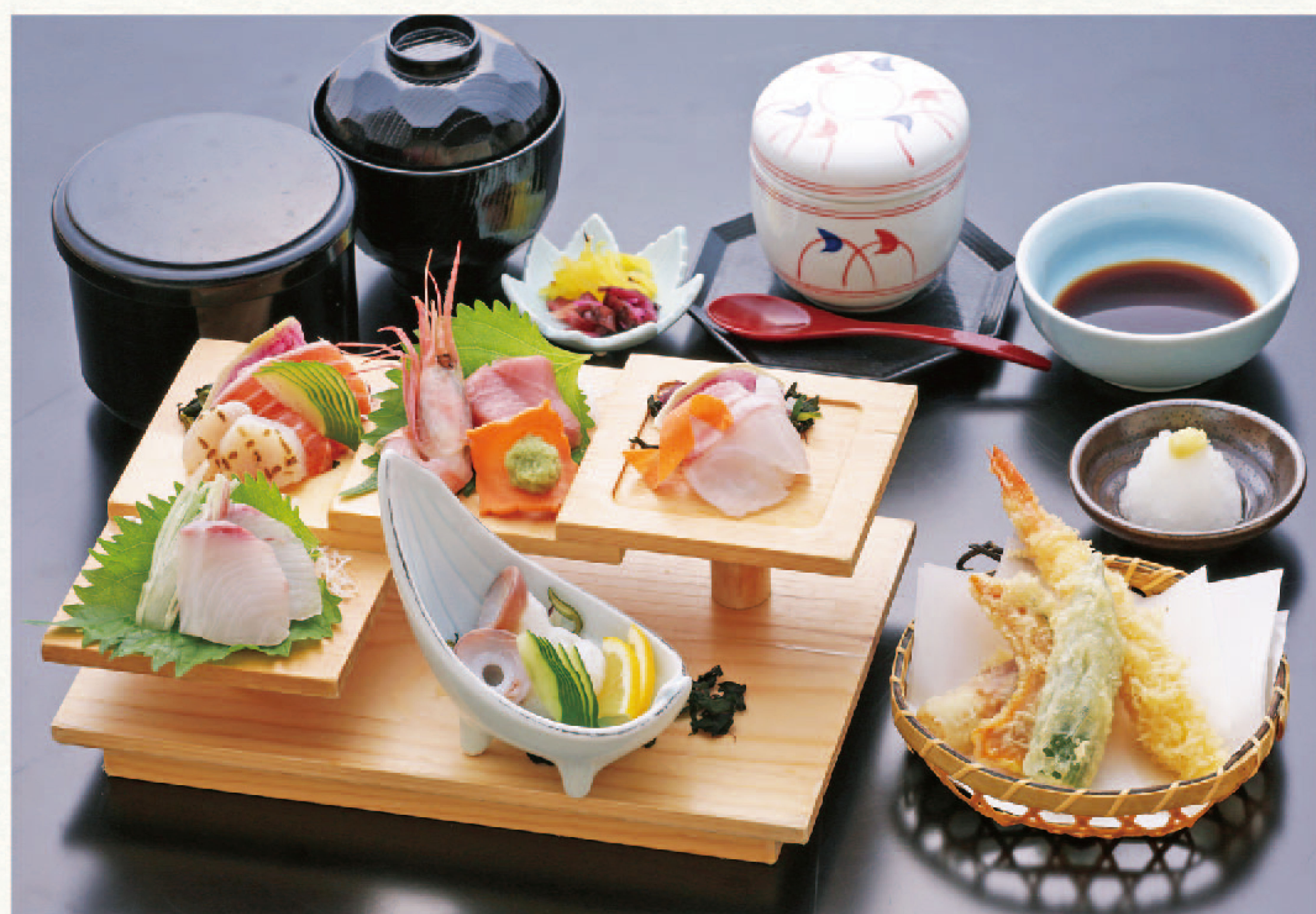
刺身6種と天ぷら・茶碗蒸セット(白飯付) 2,990円+税(税込3,289円)