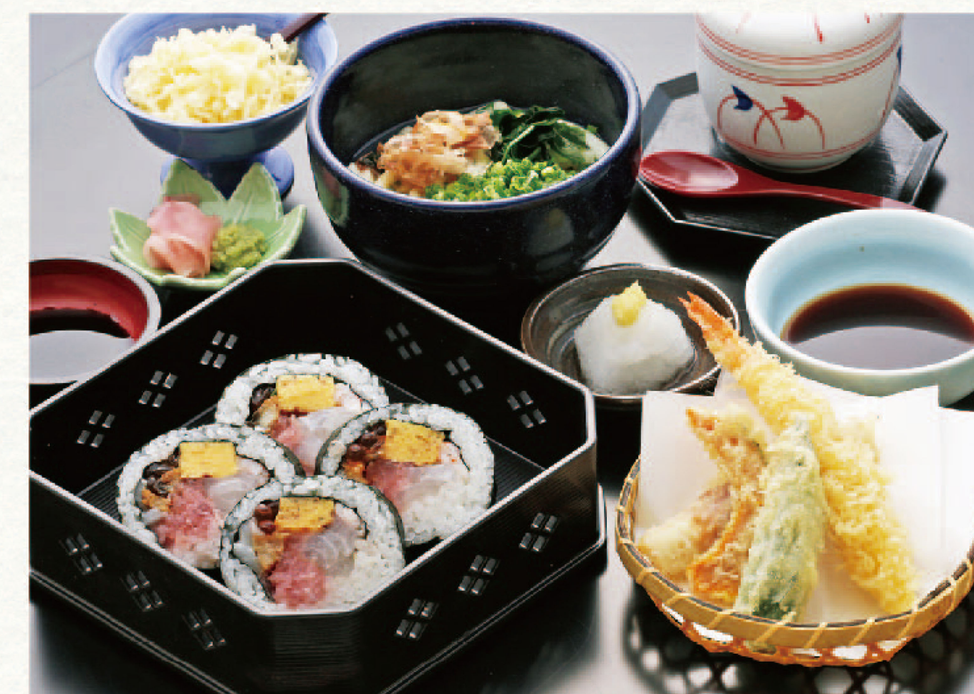
松研巻4切と天ぷら・茶碗蒸・麺セット 2,290円+税(税込2,519円)