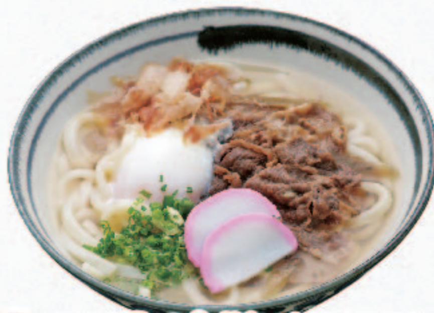
温 近江牛入り温玉肉うどん 1,480円+税 (税込1,628円)