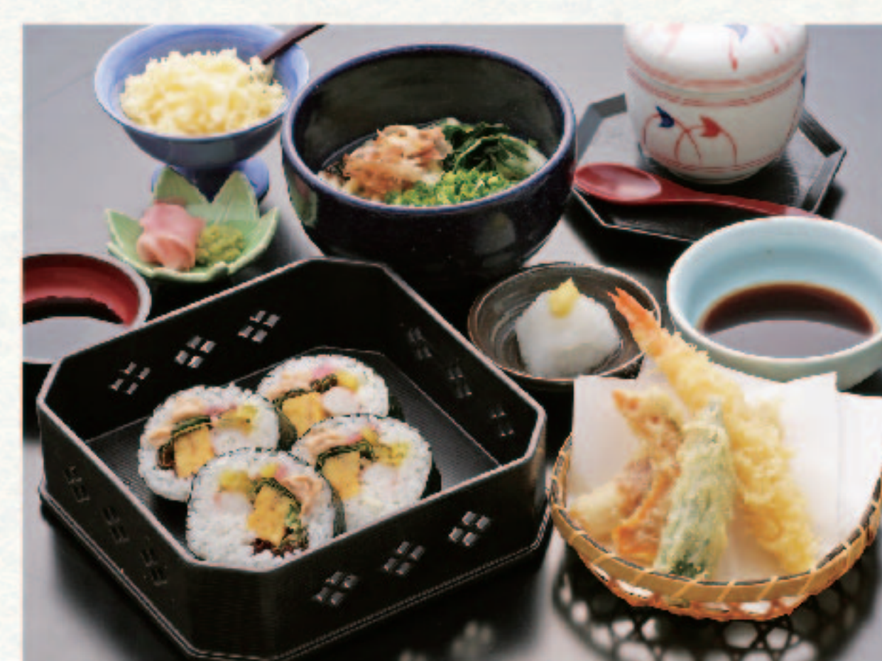
サラダ巻4切と天ぷら・茶碗蒸・麺セット 1,780円+税 (税込1,958円)