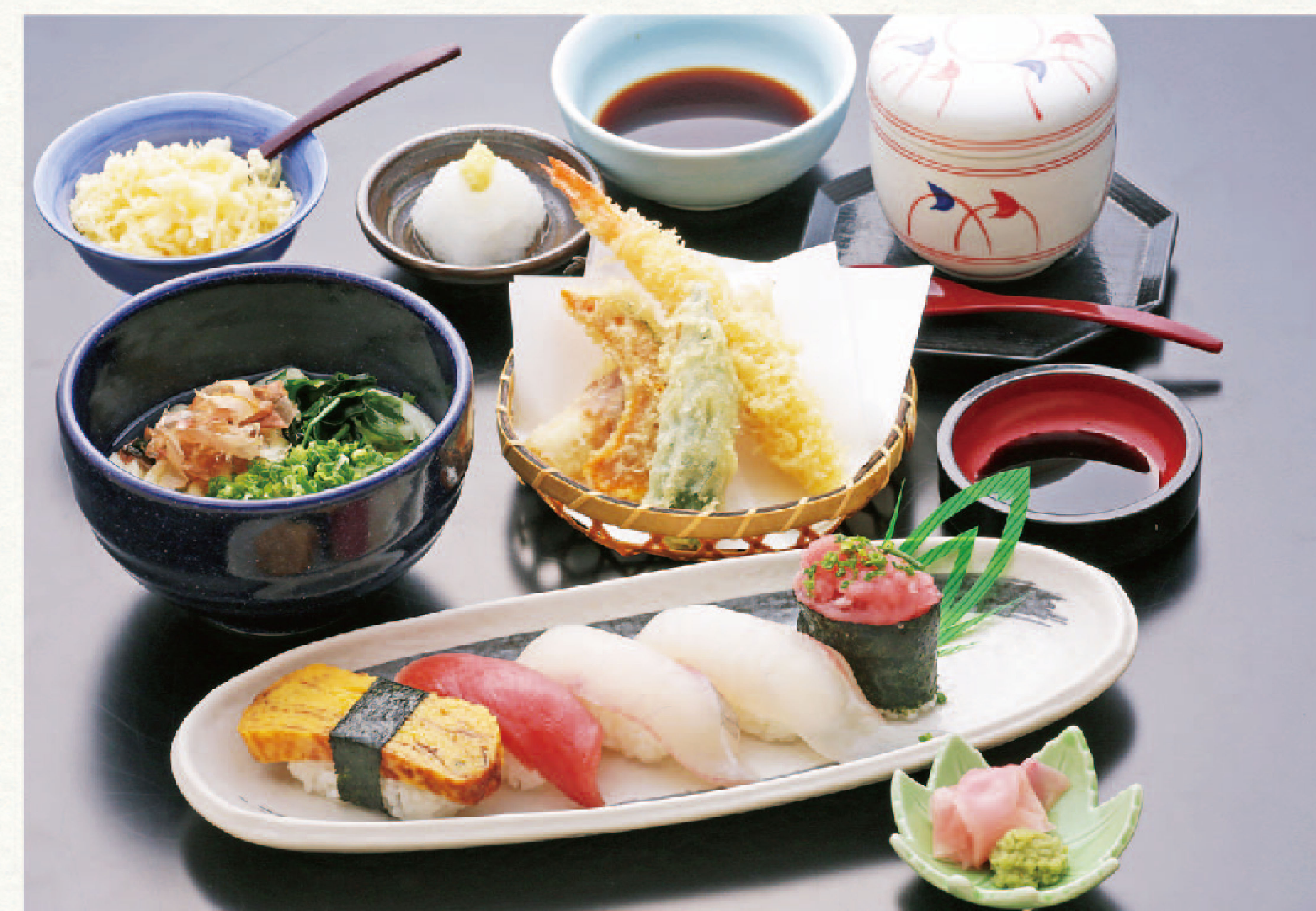
にぎり寿司5貫と天ぷら・茶碗蒸・麺セット 2,290円+税(税込2,519円)