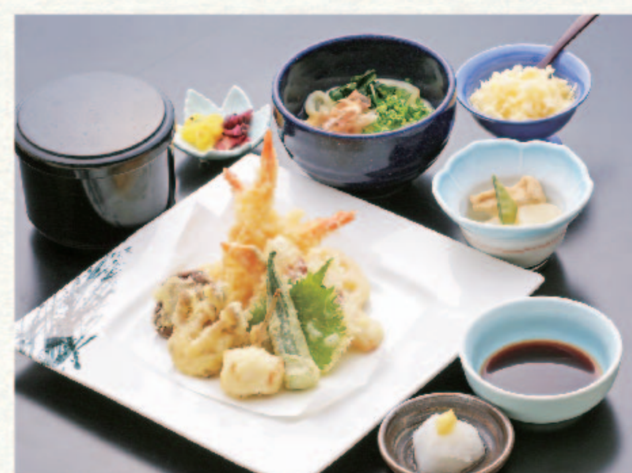
天ぷら定食 1,490円+税 (税込1,639円)