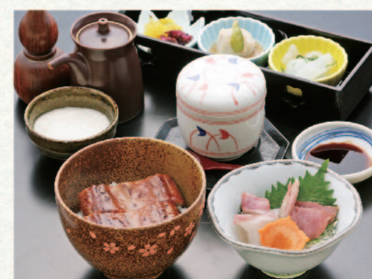
ミニうなぎ丼 (うなぎ1/4尾) と刺身・茶碗蒸又はあら汁セット 2,980円+税 (税込3,278円)