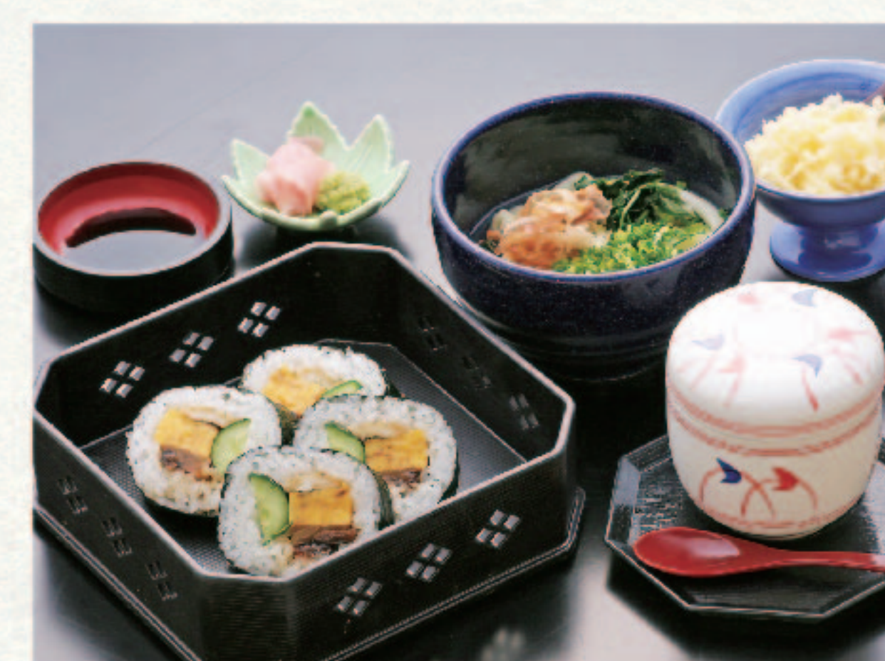
近江巻4切と茶碗蒸・麺セット 1,280円+税 (税込1,408円)